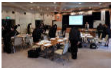
新入社員研修講座