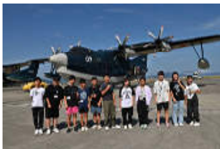
こども飛行艇教室▶