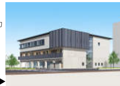
山口県東部産業振興センター(仮称)イメージ図▶