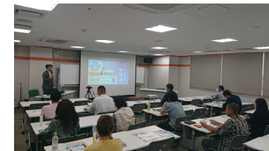
デジタル活用セミナー