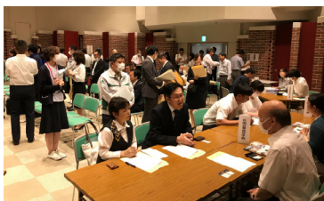
高校進路指導担当との懇談会