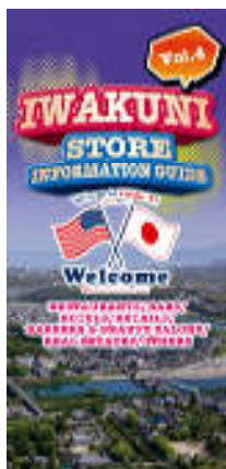
◀ウェルカムステッカー事業（お店紹介冊子）