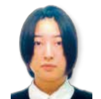
船津 桜子 吉田龍志公認会計士事務所