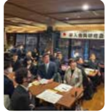
新入会員研修会の様子