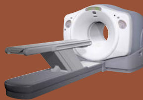
■PET-CTによる画像症例(肺がん)

がん細胞は正常細胞よりも3~8倍のブドウ糖を消費する点に着目し、疑似ブドウ糖にポジロン(陽電子)を放つ物質を組み込んだ薬剤を注射、がん病巣に集積する様子を画像化します。「細胞の代謝や血流から悪性度等、機能情報を画像化できるPET(陽電子放射断層撮影)」「病変部の体内での位置が正確にわかるCT」を組み合わせた画像診断装置です。これにより、全身を短時間の診断で小さながんの発見や腫瘍の良性・悪性の判断が可能となりました。